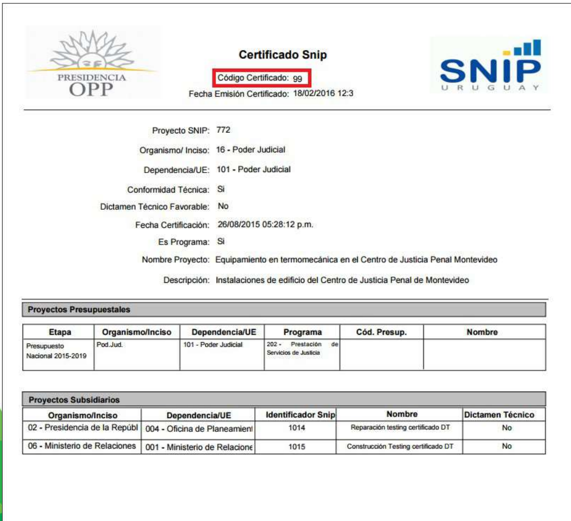
Ilustración 6: Certificado de Dictamen Técnico SNIP

Una vez generado el Certificado de Dictamen Técnico SNIP; este presentará un “código de Certificado” que se ubica en la parte superior del mismo y será el utilizado para la consulta.