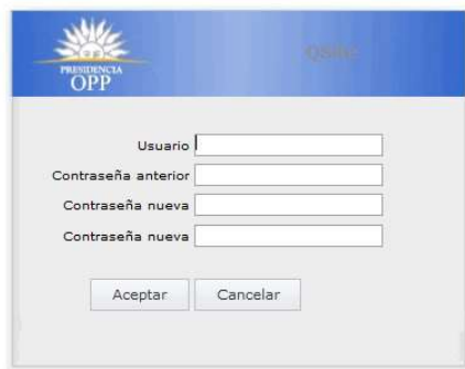
Ilustración 2: Cambio de contraseña

Para cambiar la contraseña se exige el ingreso de la contraseña anterior y el ingreso de la nueva contraseña, para finalizar deberá hacer clic en “Aceptar”.