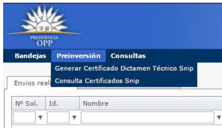
Ilustración 3: Opción de Menu

Para poder generar el Certificado SNIP se deberá seleccionar la opción de menú “Preinversión” y dentro de la misma la opción “Generar Certificado Dictamen Técnico Snip” como se muestra en la imagen siguiente.