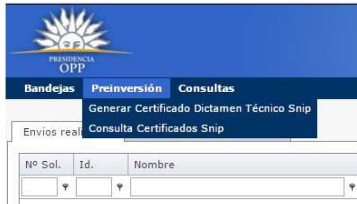
Ilustración 7: Opción de Menú

Para poder consultar el Certificado SNIP se deberá seleccionar la opción de menú “Preinversión” y dentro de la misma la opción “Consulta Certificados Snip” como se muestra en la imagen siguiente.