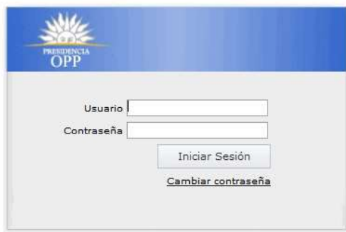
Ilustración 1: Inicio sesión

Para acceder al Banco de Proyectos primero ingresar al navegador de Internet que tenga instalado el equipo (puede ser Internet Explorer, Firefox, Chrome; sin embargo se recomienda Chrome) y se mostrará la siguiente pantalla: