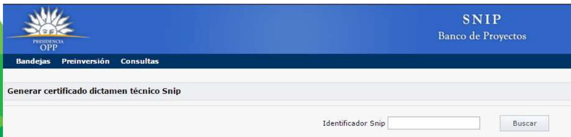
Ilustración 4: Generar Certificado SNIP

El sistema desplegará una pantalla en donde le requerirá al usuario el ID del proyecto para el cual requiere el certificado.